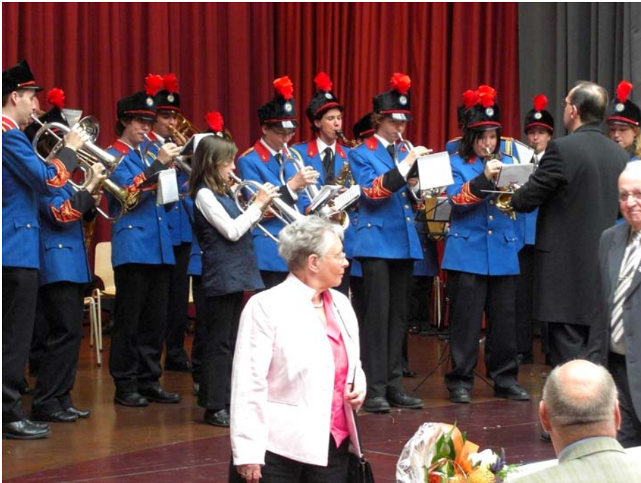
(In het gemeentehuis worden de gedecoreerden gehuldigd)

Dit alles werd uitgezonden op Omroep Landgraaf dus ook nog eens extra publiciteit voor onze fanfare.