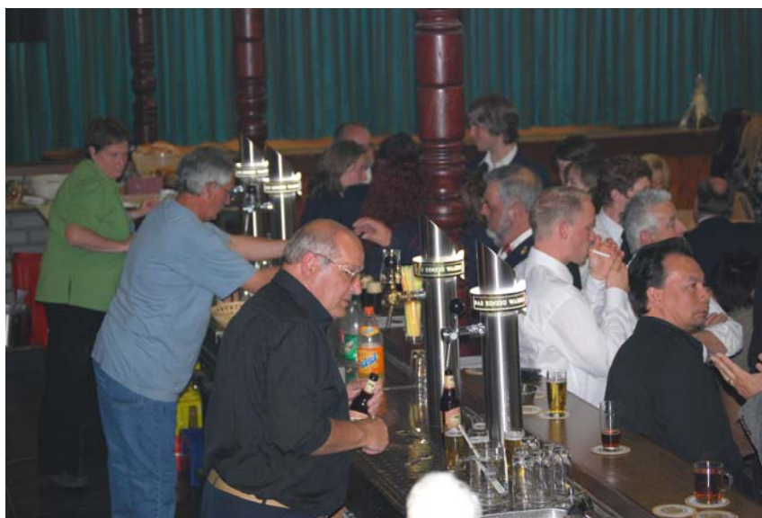
Enkele van onze hard werkende vrijwilligers achter de bar