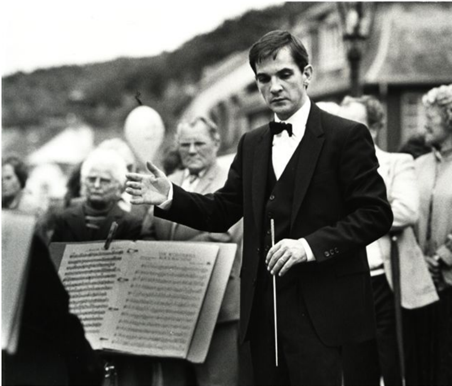
Zo zag Math er in 1986 uit.

Dus nu een terugblik naar 1986. Het jaar dat onze dirigent bij onze vereniging begon.