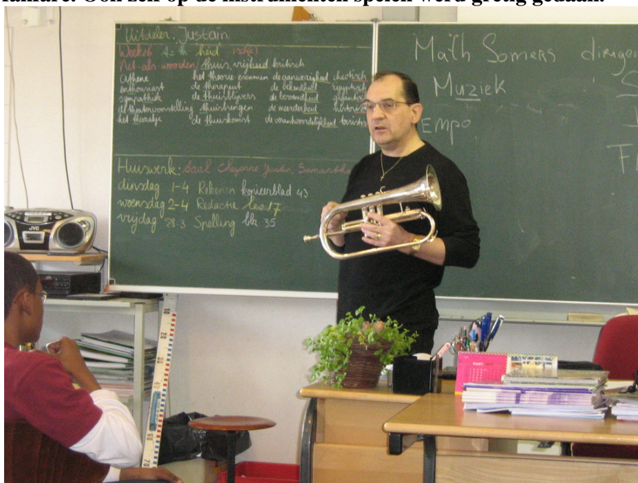
(Math legt uit wat een bugel is)

Tijdens en mini concertje mochten alle kinderen tussen het orkest komen zitten. Na afloop kreeg iedereen een glaasje fris en wat lekkers. Deze vriendjesdag was een groot succes daar 2 kinderen na deze avond begonnen zijn aan onze interne muzikopleiding. De workshop van vrijdag 28 Maart op Basisschool Kakertshöfke was ook een groote succes. De kinderen vonden de workshop interessant en door de infodvd over onze eigen fanfare merkten ze op dat we toch wel leuke muziek spelen in de fanfare. Ook zelf op de instrumenten spelen werd gretig gedaan.