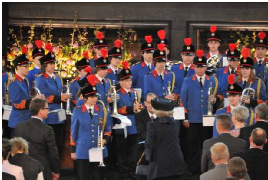
De Koningin spreekt lovende woorden en geeft een hand