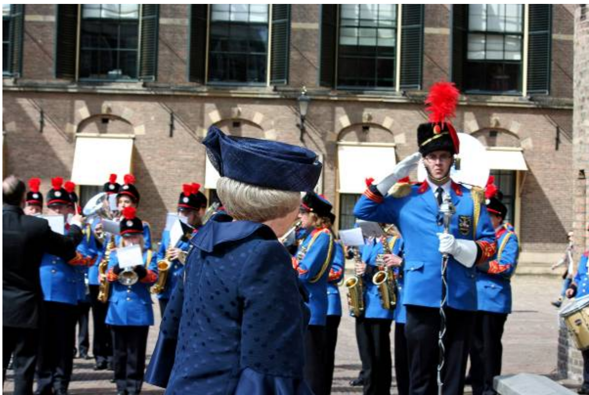
Onze Bjorn begroet Hare Majesteit op gepaste wijze.

En dan brak het mooiste moment van de dag aan. Hier hadden we maanden lang voor gerepeteerd. We hadden de eer om als enige ooit de entree te maken in de Ridderzaal via de hoofdingang. Die is normaal alleen gereserveerd voor de Koningin. Zelfs de genodigden mochten niet via de hoofdingang naar binnen. In rijen van 2 stonden we opgesteld bij de treden van de Ridderzaal en zodra de ceremoniemeester ons aankondigde, gingen de deuren open en marcheerden we muzikaal naar binnen. Ja, wat je dan voelt, dat is met geen pen te beschrijven dus dat probeer ik dan ook maar niet, maar het was geweldig.