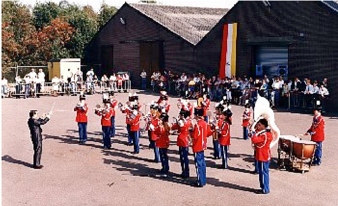
Concours in Helden Panningen in 1992. Ons verplicht werk was stilstaand en we deden een marcherend werk.

Nu hadden we te maken met een inspelwerk en werden we op 3 grote concertwerken beoordeeld en musicerden we zittend en duurde het optreden zeker 25 a 30 minuten. Maar het was wel een veel prettigere ervaring met een goed juryrapport dat opbouwende en eerlijke kritiek bevatte.