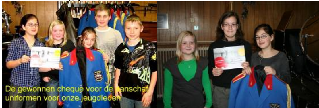
De gewonnen cheque voor de aanschaf uniformen voor onze jeugdleden

We hadden voor de pers enkele foto's gemaakt voor bij het artikel. Helaas werden deze niet geplaatst dus doen we het maar hier.