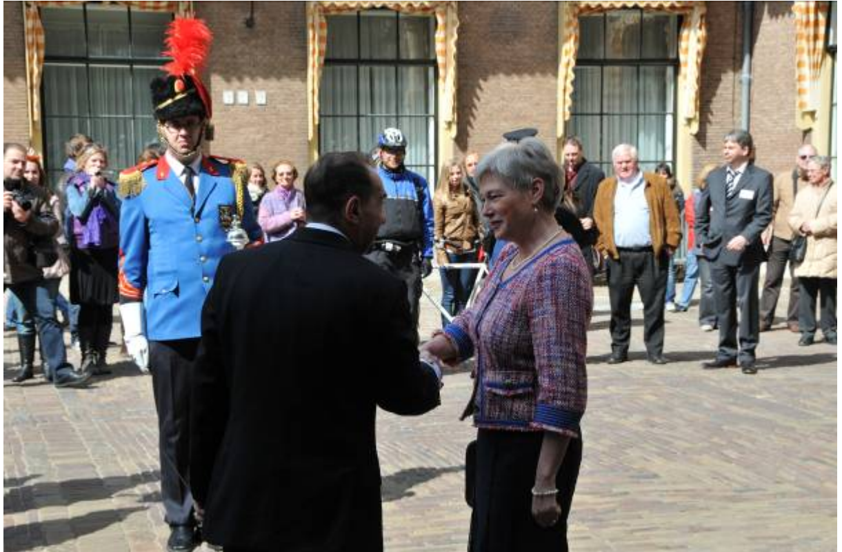
Minister van der Hoeven bedankt onze dirigent voor onze deelname

Het was nu 14.45 uur en dat betekende dat wij ons moesten opstellen aan de hoofdingang van de Ridderzaal. Daar zouden wij de aankomst van Hare Majesteit muzikaal omlijsten. De beveiliging instrueerde ons waar wij precies moesten staan en 7 minuten voordat Hare Majesteit zou arriveren moesten wij beginnen met musiceren. We mochten pas stoppen met musiceren nadat de koningin binnen was. Aan de beveiliging was te zien wanneer de koningin aankwam. Een minuut daarvoor werden ze onrustig en werd er druk gecommuniceerd via de oortjes en microfoontjes aan hun kragen.