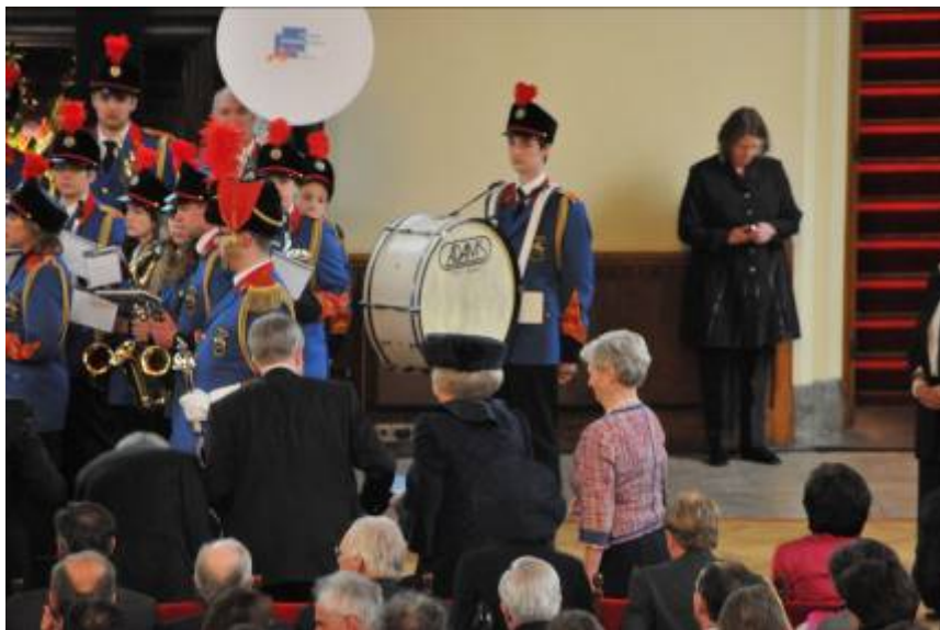
De Koningin staat op om de dirigent te bedanken

stond niet definitief vast, want de Koningin beslist zo iets zelf ter plekke of ze dat doet of niet.