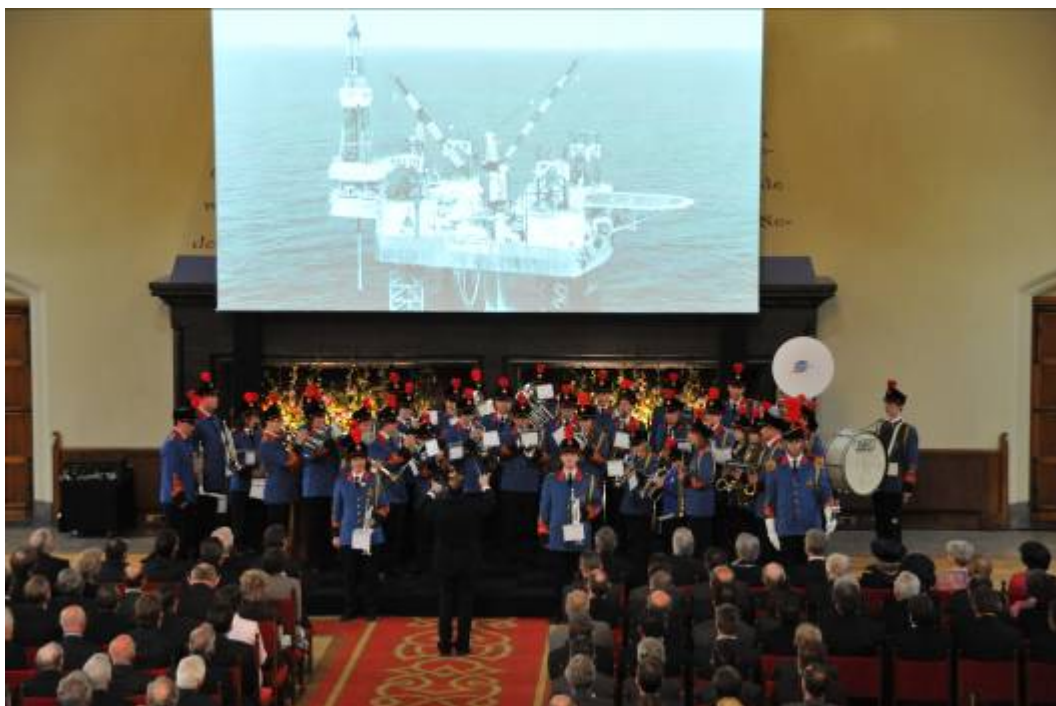
Ons optreden in de ridderzaal tijdens de uitvoering van “De Steigermars”

Dat wij heel erg trots zijn moge duidelijk zijn. Ook de pers wist ons weer te vinden en besteedde veel aandacht aan dit gebeuren en onze vereniging.